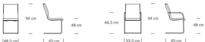
S 56 PV