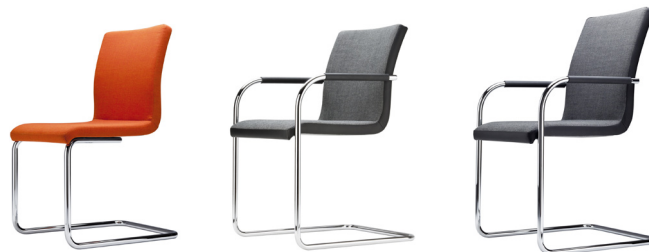
S 55 PV