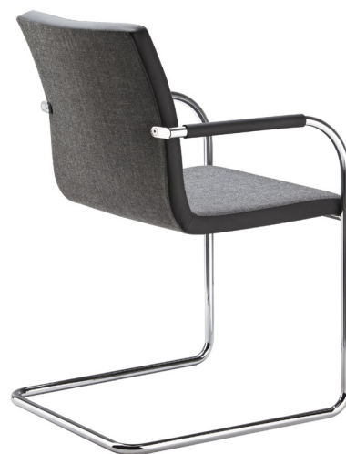
S 56 PVF