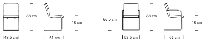
S 55 PV