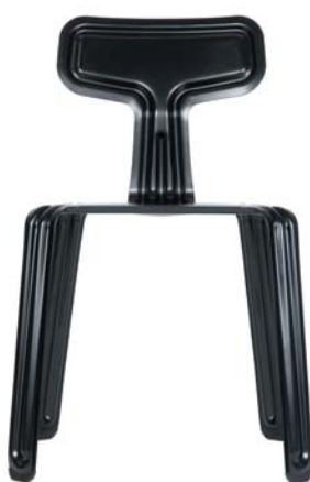
pulverbeschichtet schwarz powder coated black