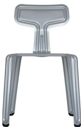
pulverbeschichtet silber powder coated silver