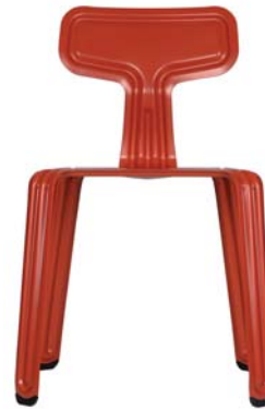
pulverbeschichtet rot powder coated red RAL 3000