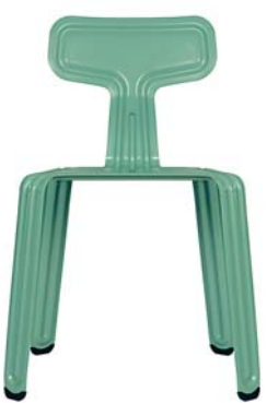
Tussi-Türkis drama-queen-green NCS S 3030-B70G