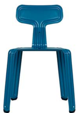
Stille-Wasser-Blau still-water-blue NCS S 6020-R90B

pulverbeschichtet matt/powder coated, matt finished