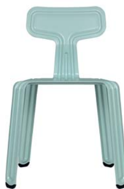
Frühtau-Blau morning-dew-blue NCS S 1515-B50G