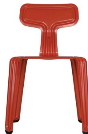
pulverbeschichtet rot powder coated red