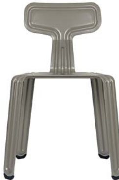
Chiemsee-Schlick lake-Chiemsee-silt NCS S 6005-Y20R