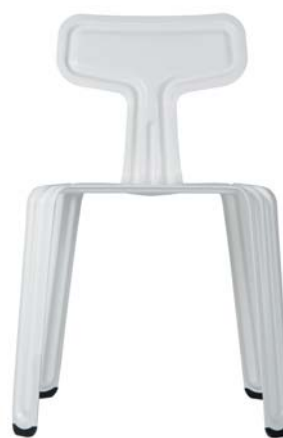
pulverbeschichtet weiß powder coated white