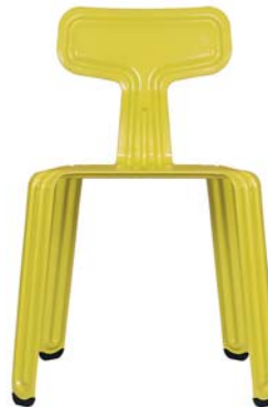
Scharfer-Senf hot-mustard NCS S 10602-G90Y

Sonderfarben (RAL-Farbtöne) sind möglich special colours (RAL colour) are possible