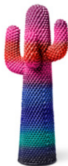
PSYCHEDELIC CACTUS cod. G01150

appendiabiti coat stand portemanteau garderobenständer perchero