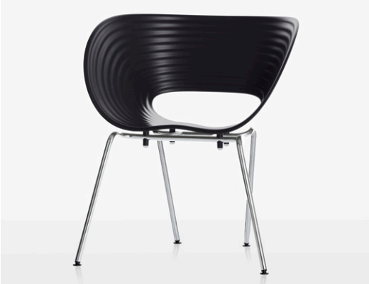
Die Wellenstruktur sorgt für Stabilität, Flexibilität und Belüftung.