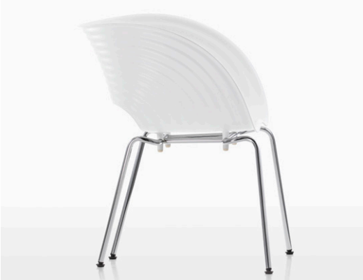
Die grosszügige Sitzschale aus Polypropylen bietet hohen Sitzkomfort.

Auch für Aussenbereiche Bei der Outdoor-Variante wird das Gestell verzinkt und pulverbeschichtet (nach RAL 9006, silberfarben). Spezielle Additive in der Sitzschale schützen vor dem Ausbleichen durch UV-Bestrahlung.