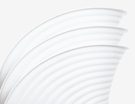
Trotz seiner grossen Schale lässt sich Tom Vac stapeln, so dass bis zu fünf Stühle Platz sparend verstaut werden können.

Alle Masse in mm und Inch, ermittelt nach EN 1335-1