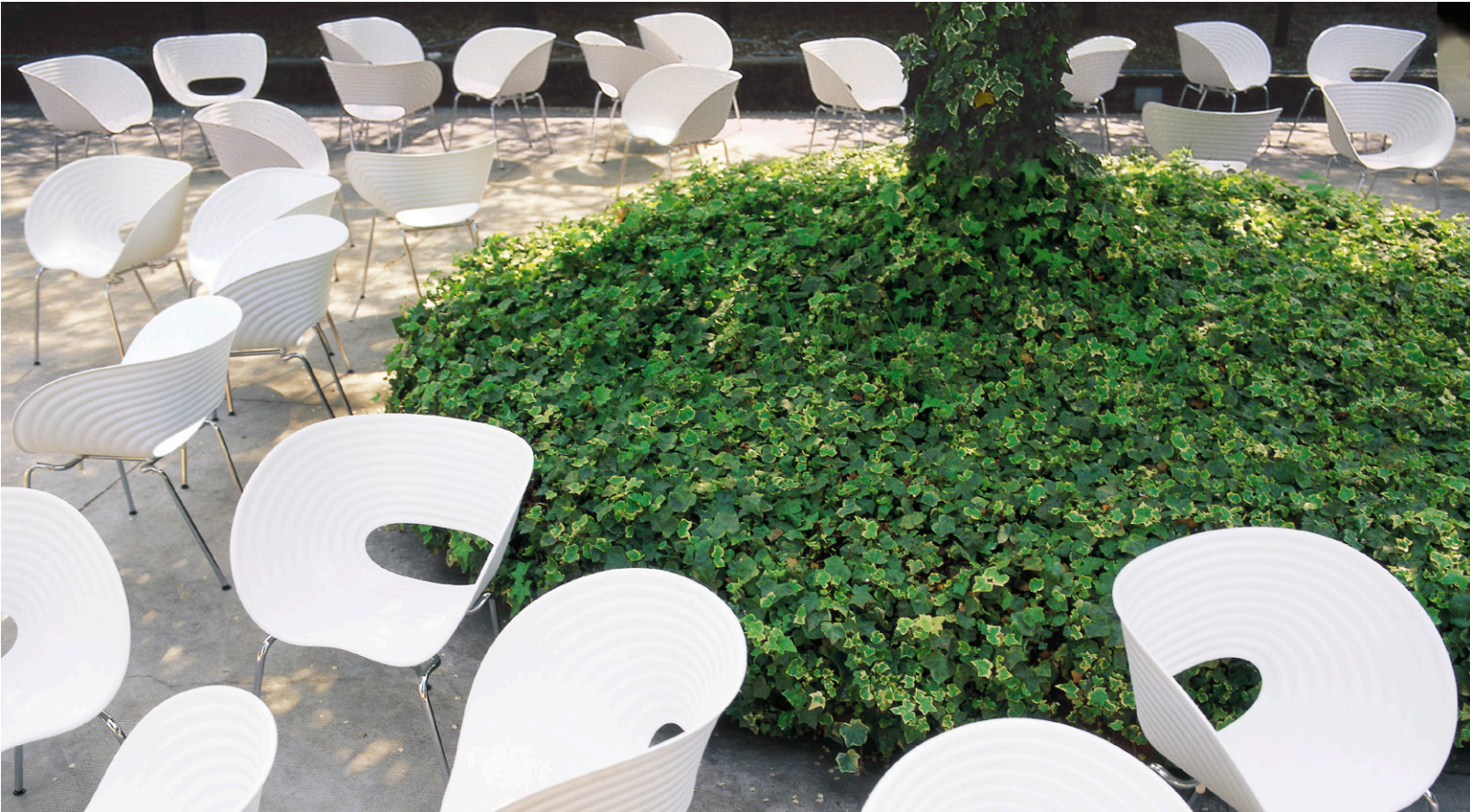
Bei der Outdoor-Variante wird das Gestell verzinkt und pulverbeschichtet.

Der anglo-israelische Designer Ron Arad hat 1997 für die Mailänder Möbelmesse einen Schalenstuhl aus Aluminium entworfen und dort aus 100 Exemplaren einen Turm gebaut. Für eine Serienproduktion waren die Stühle aber zu unkomfortabel und ihre Herstellung war zu aufwendig. Mit Vitra entwickelte Arad daraufhin die so charakteristische, breite Kunststoffschale von Tom Vac. Sie bietet hohen Komfort und ihre Wellenstruktur sorgt für Stabilität und gleichzeitige Flexibilität. Tom Vac lässt sich stapeln, so dass bis zu fünf Stühle Platz sparend verstaut werden können.