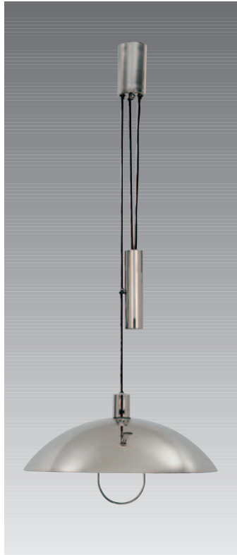
HMB 25/500 ZNi