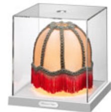
TecaMini Renaissance Cupola design by Ron Gilad