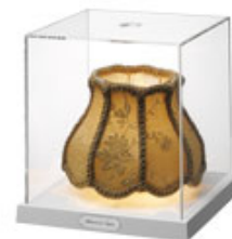
TecaMini Victorian Grandeur design by Ron Gilad