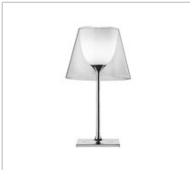
Ktribe T2 design by Philippe Starck

Tischleuchte für den Innenbereich für diffuses Licht.