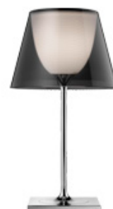
KTribe T1 Switch design by Philippe Starck

Bewegbare Tischleuchte für den Innenbereich mit diffusem Licht.