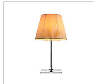
Ktribe T2 Soft design by Philippe Starck

Tischleuchte für den Innenbereich mit diffusem Licht.