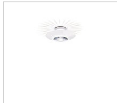
Moni 1 design by Achille Castiglioni

Deckenleuchte für reflektiertes und diffuses Licht