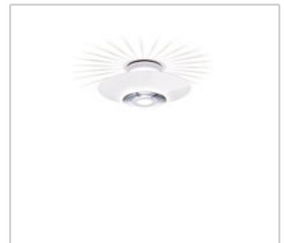
Moni 2 design by Achille Castiglioni

Deckenleuchte für reflektiertes und diffuses Licht