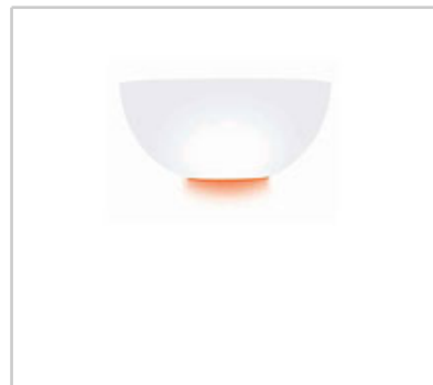
Nord I design by Rodolfo Dordoni

Wandleuchte für diffuses und indirektes Licht